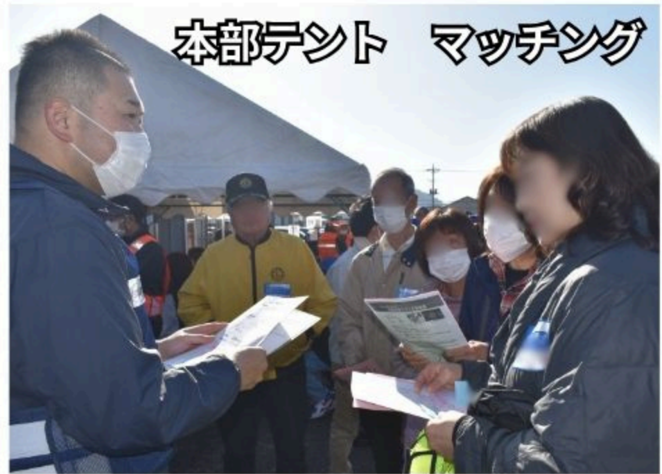
本部テント マッチング