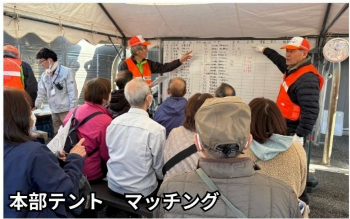
本部テント マッチング