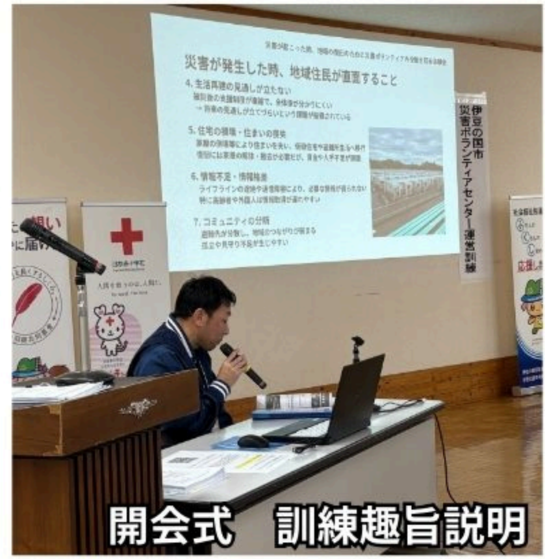
開会式 訓練趣旨説明