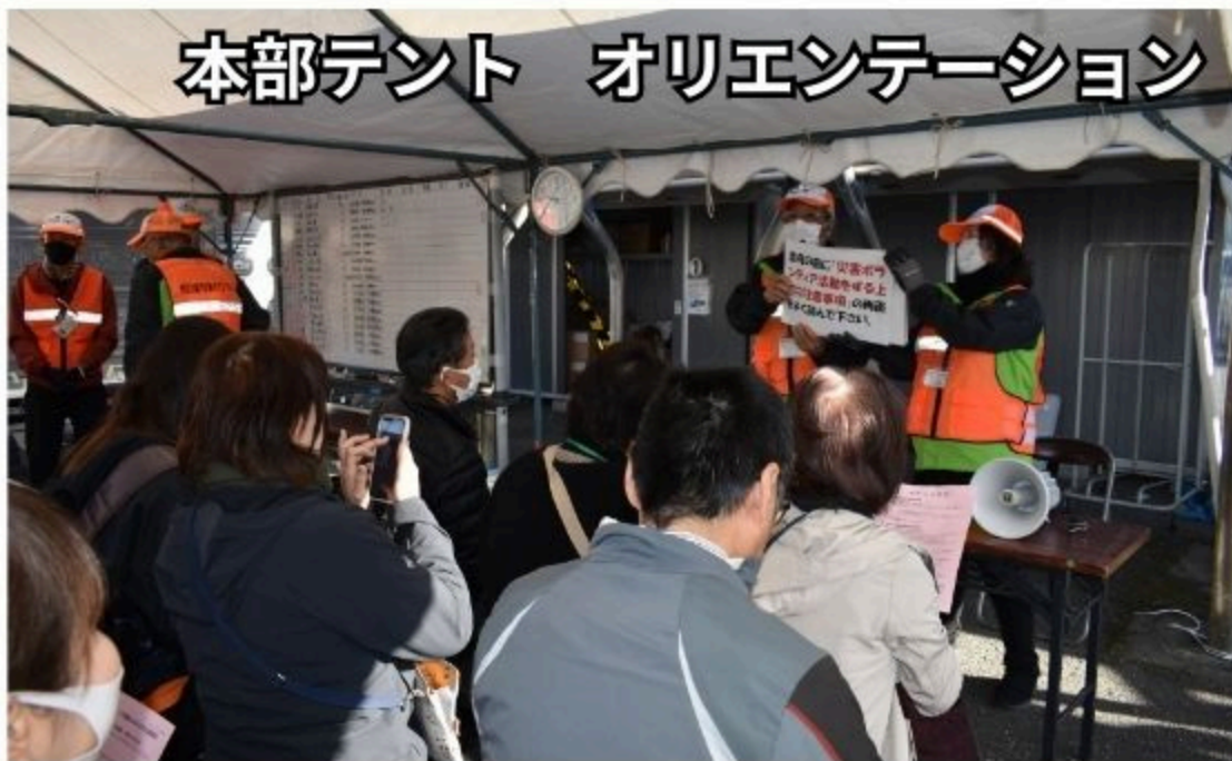
本部テント オリエンテーション