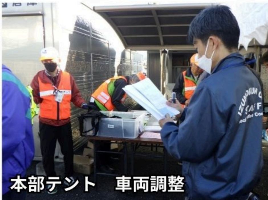
本部テント 車両調整