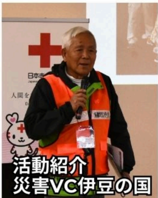
活動紹介 災害VC伊豆の国