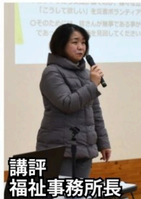
講評 福祉事務所長