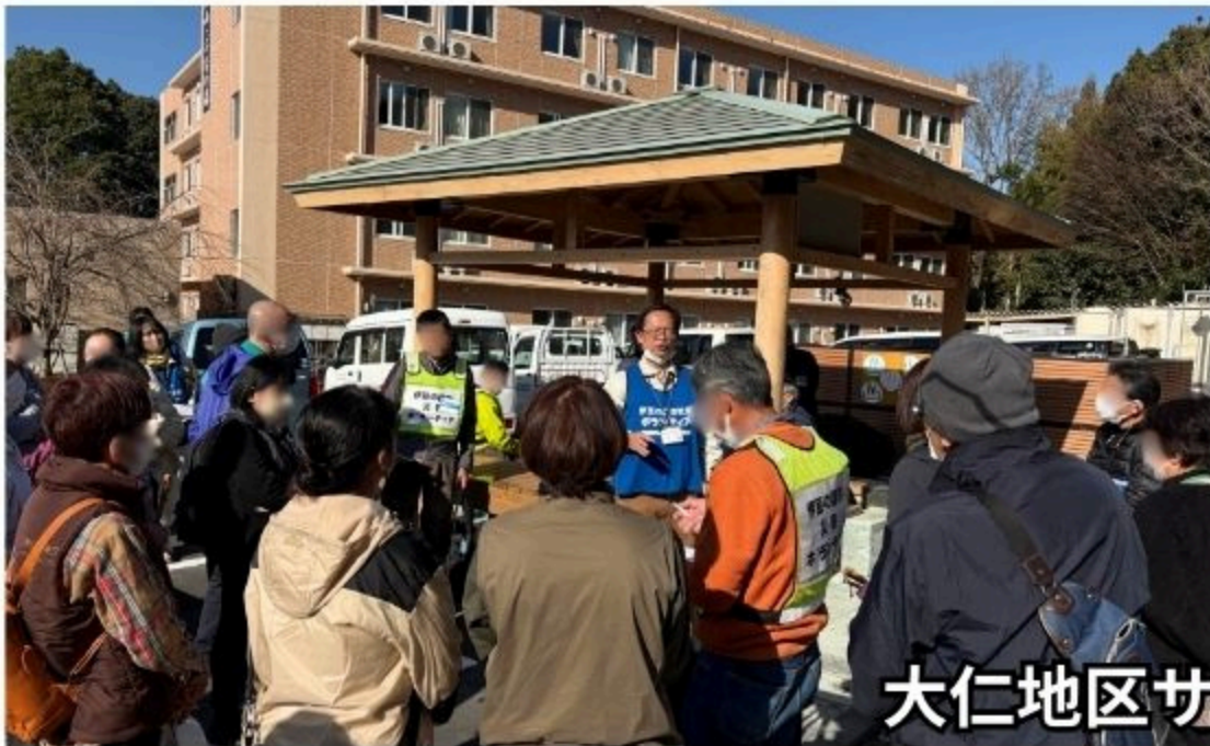
大仁地区サテライト