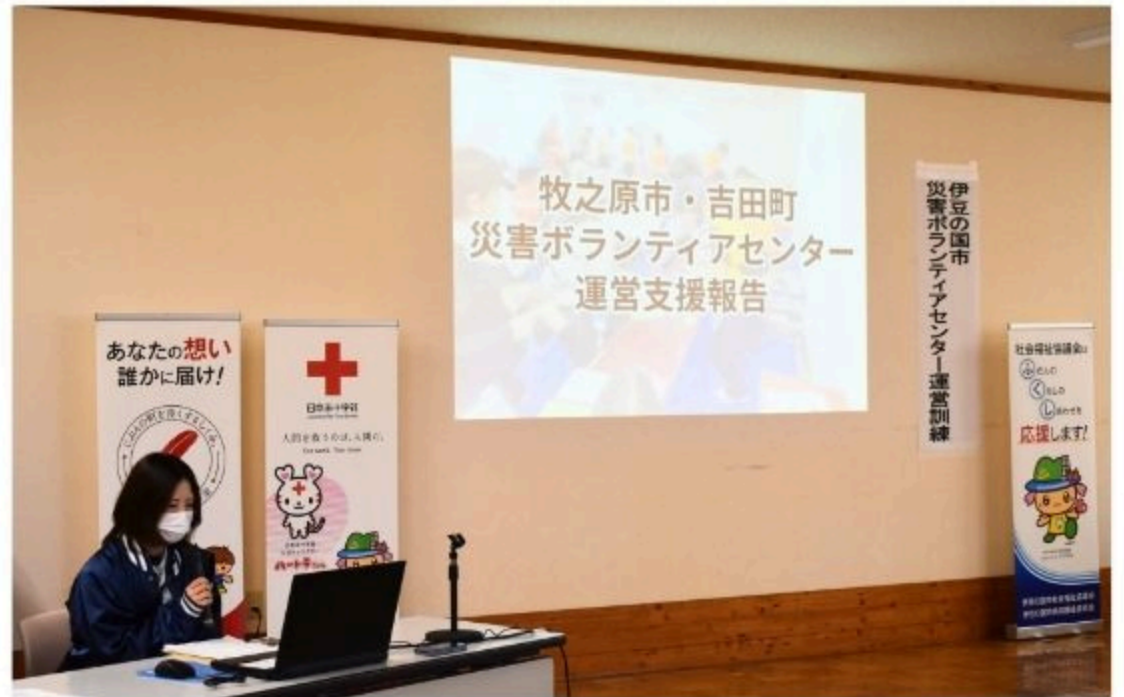
閉会式(訓練の振り返り、伊豆の国市社協災害支援活動報告)