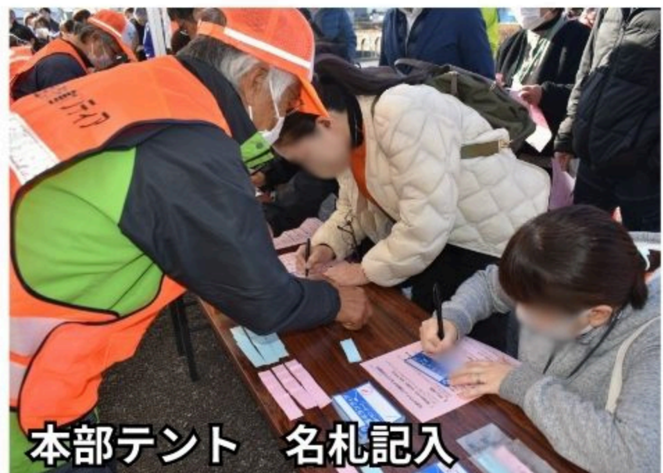
本部テント 名札記入