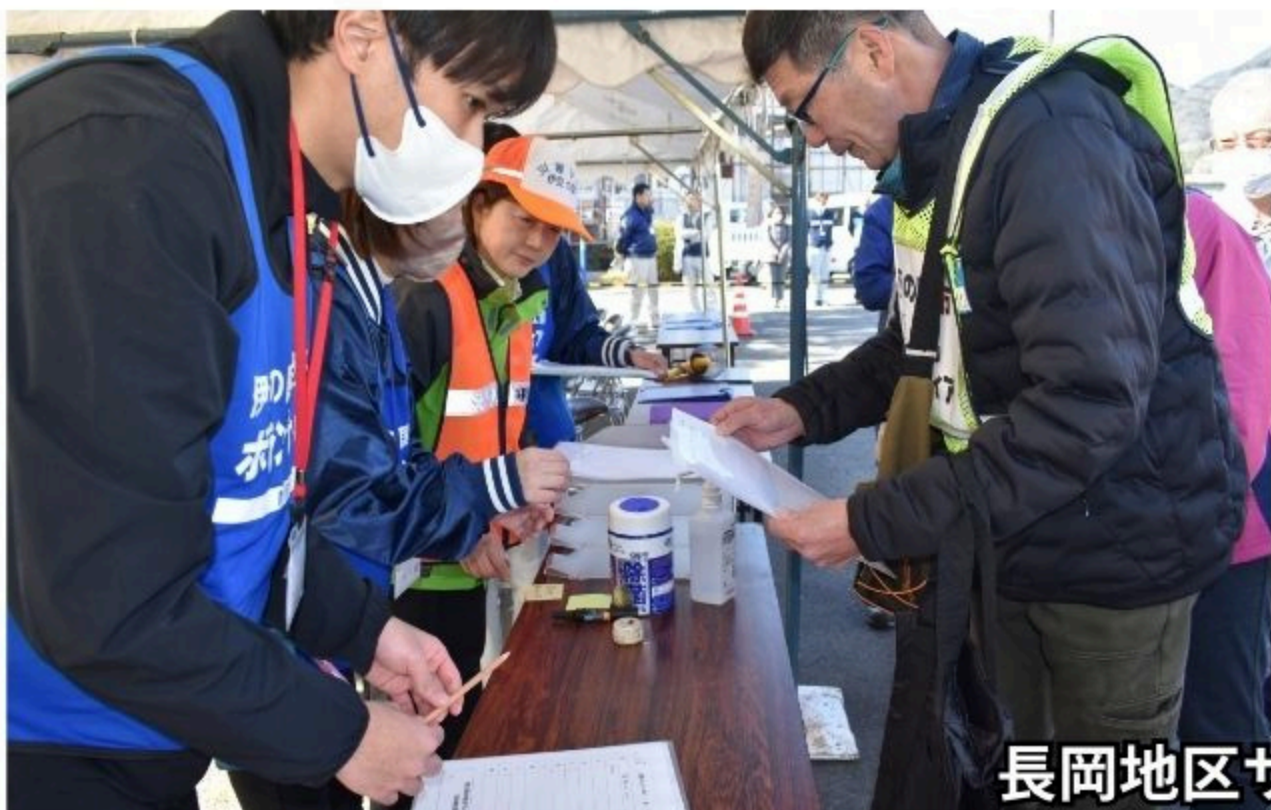
長岡地区サテライト