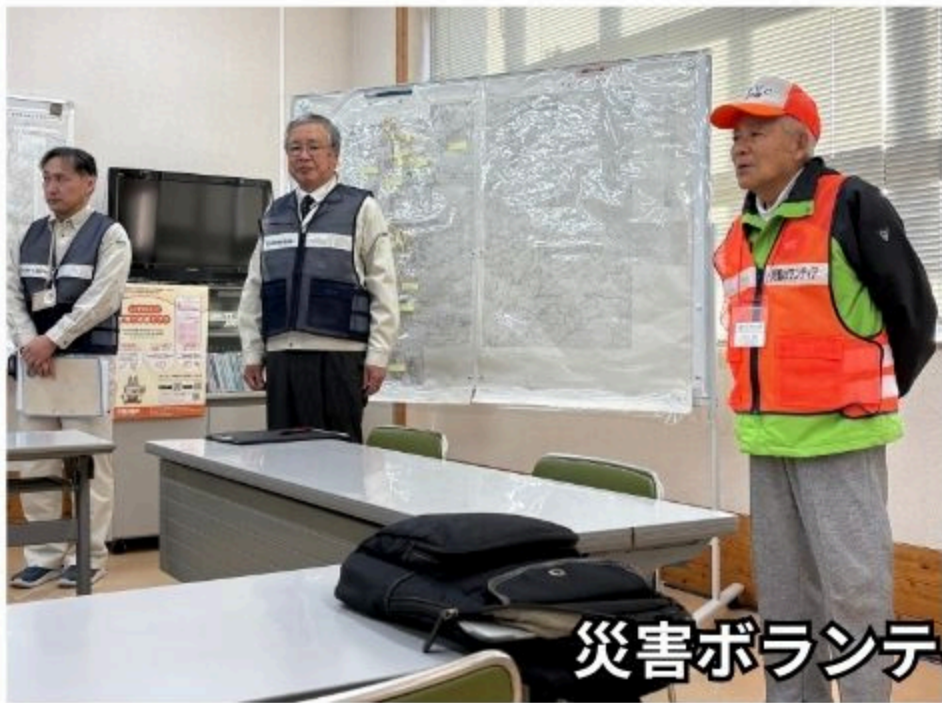
災害ボランティアセンター朝礼