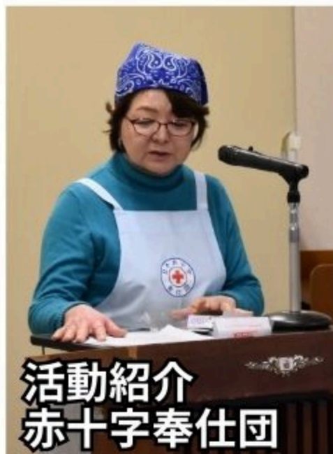
活動紹介 赤十字奉仕団