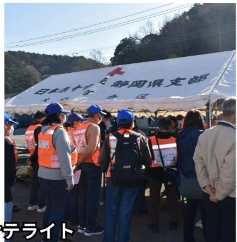
長岡地区サテライト